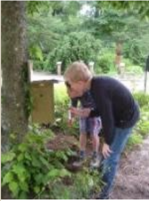
Skovlund Naturskole, Nybo Bakke i Holstebro.