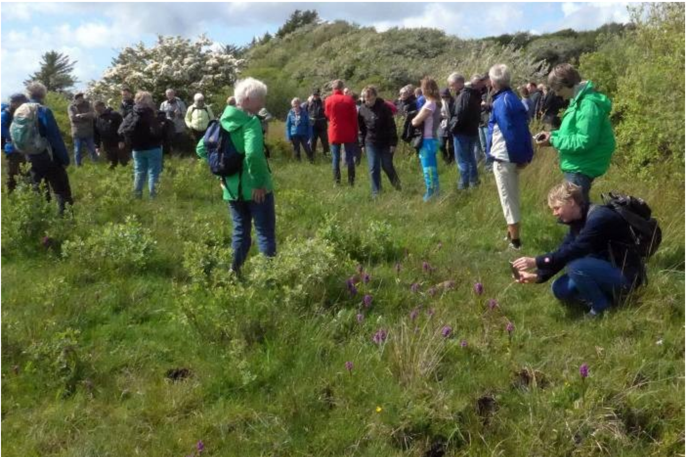
Orkideerne studeres og fotografes