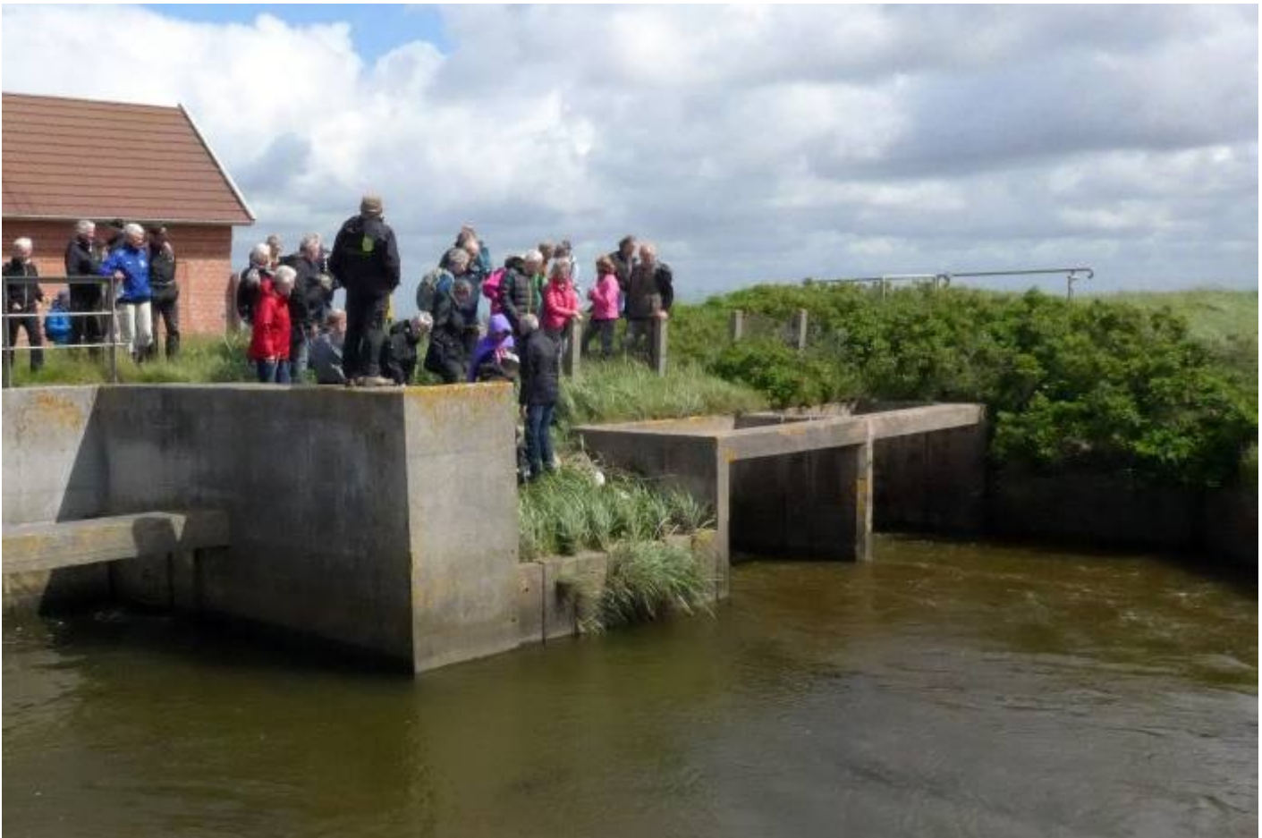
Pumperne er sat igang