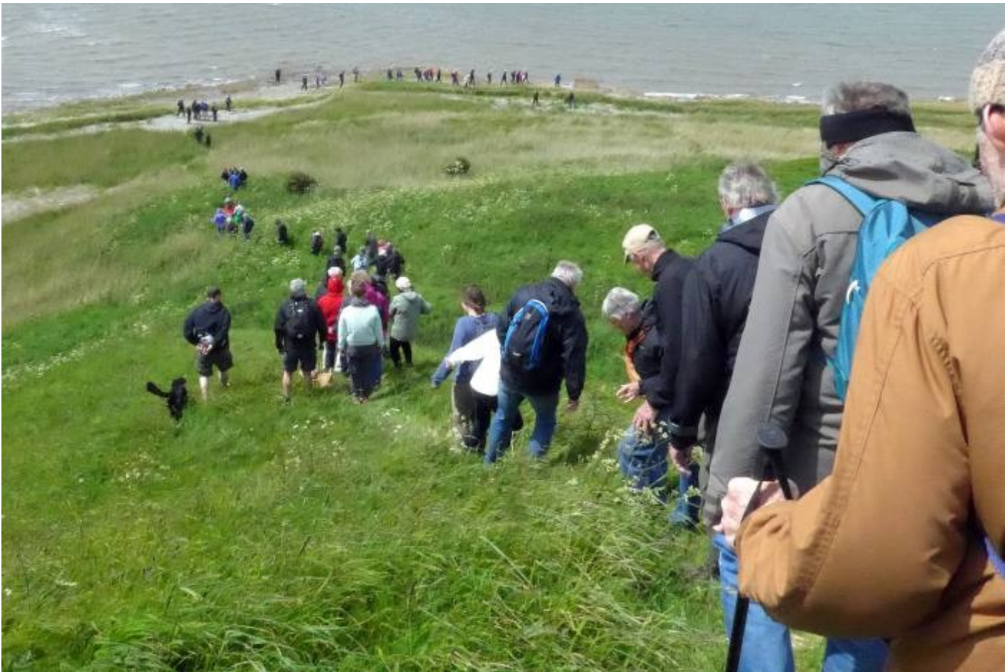
Nedstigning ad den høje og stejle skrænt