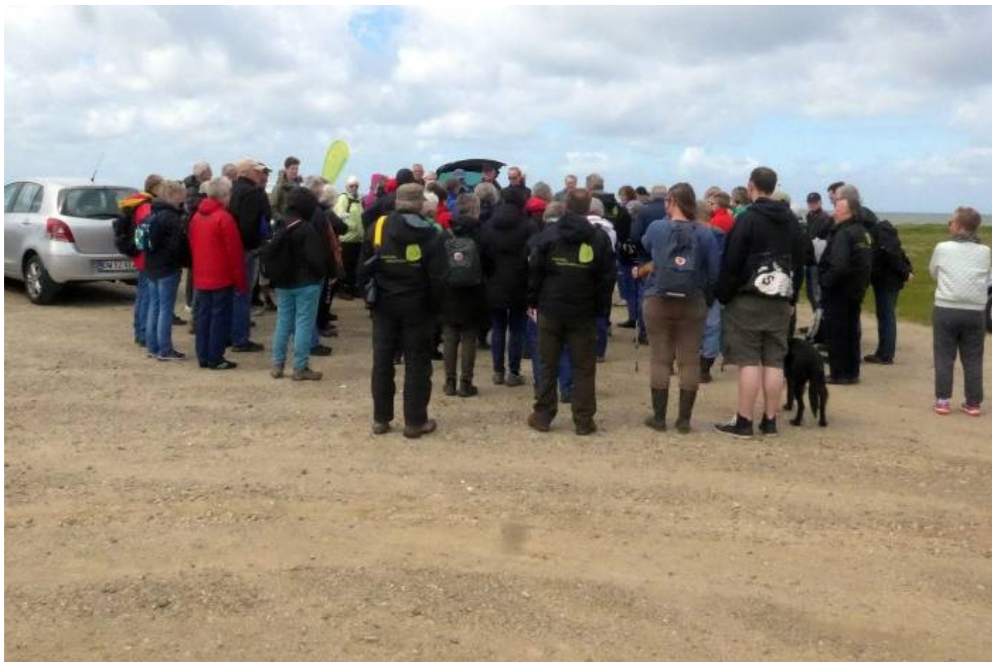
Ole Primdahl byder velkommen

Efterfølgende var der en del, der tog med retur med hestevogn, styret af Lars Bak. Flere var så friske, at gå hele vejen tilbage til Ejsingholm.