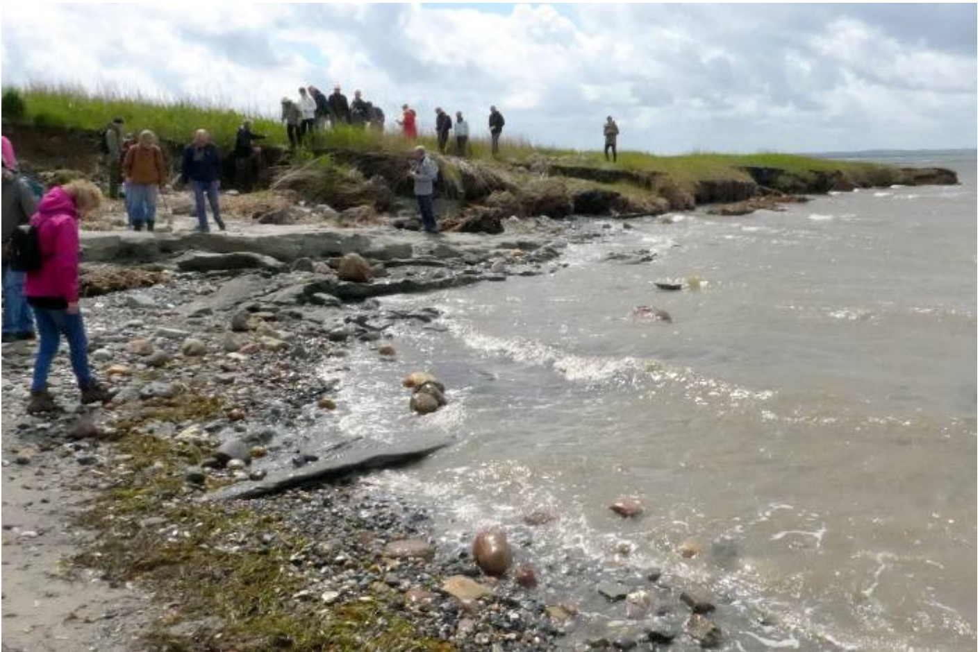
Tunger af ler strækker sig ud i vandet